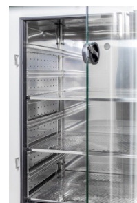
Puerta interior de cristal