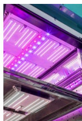
Detalle: Luces en estantes