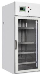
Puerta exterior de cristal